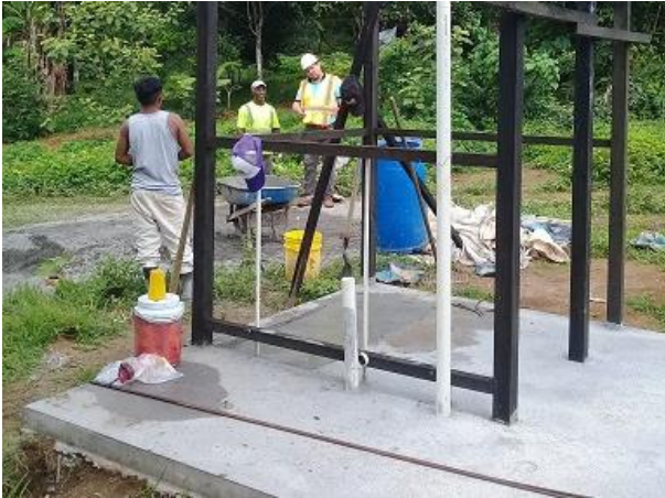
Fotografía 3: Unidad básica sanitaria en construcción en Peña Prieta (LPN-04). Junio 2019.