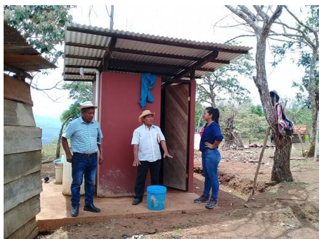
Fotografía 1: Unidad de Saneamiento Básico en Chichica (LPN-02). Abril 2019.